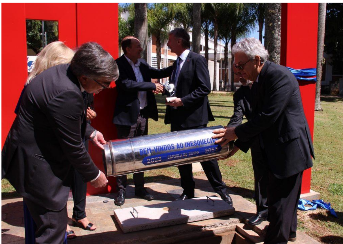
Cerimônia de enterramento da cápsula do tempo.