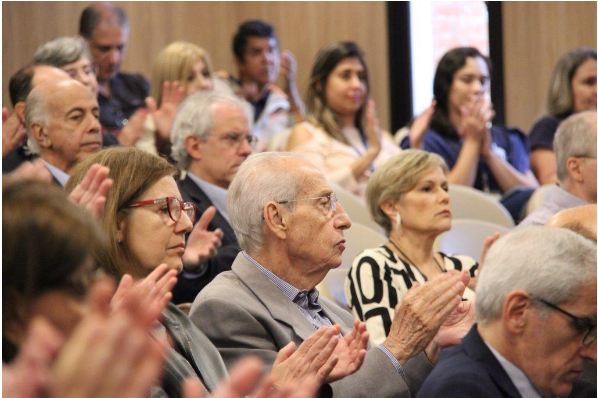
Plateia acompanha a cerimônia de posse.