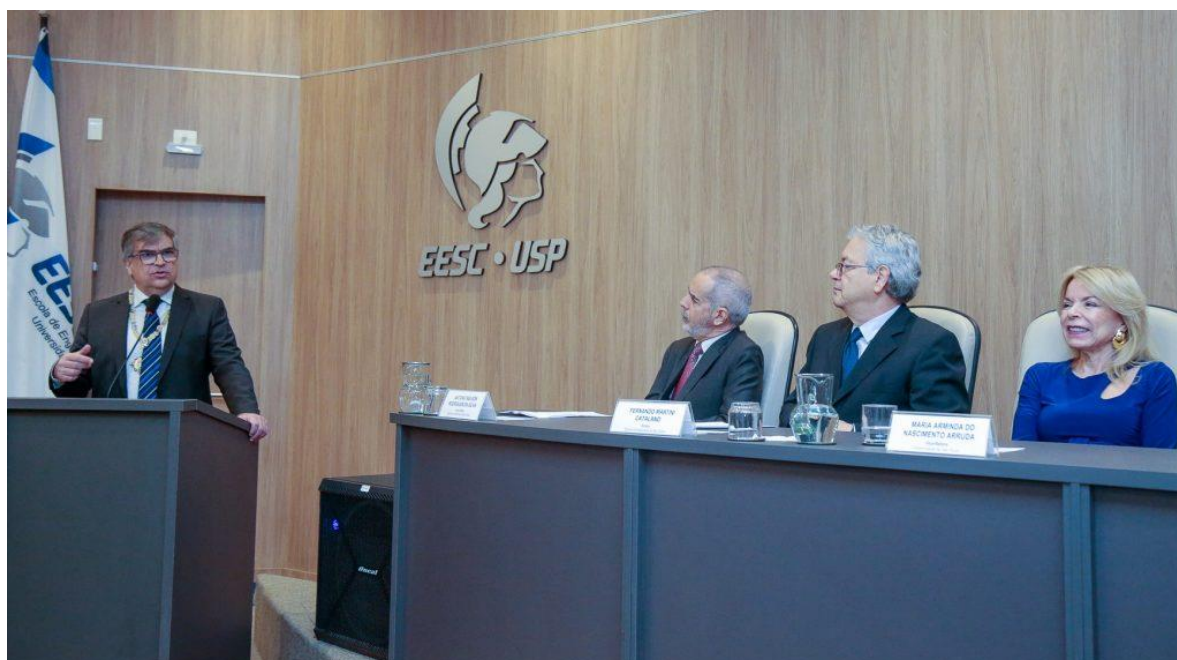
O Reitor da USP durante a posse dos novos diretor e vice-diretor da EESC-USP