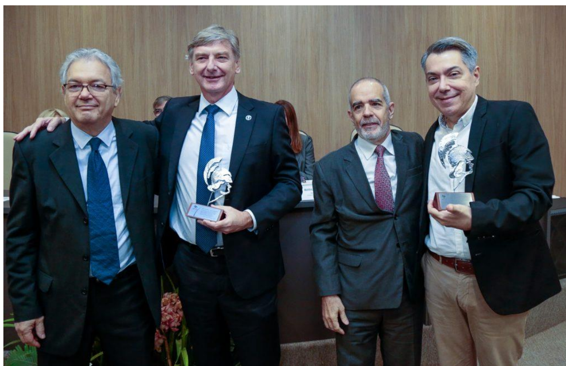
Ex-diretor e ex-vice-diretor recebem escultura minerva.