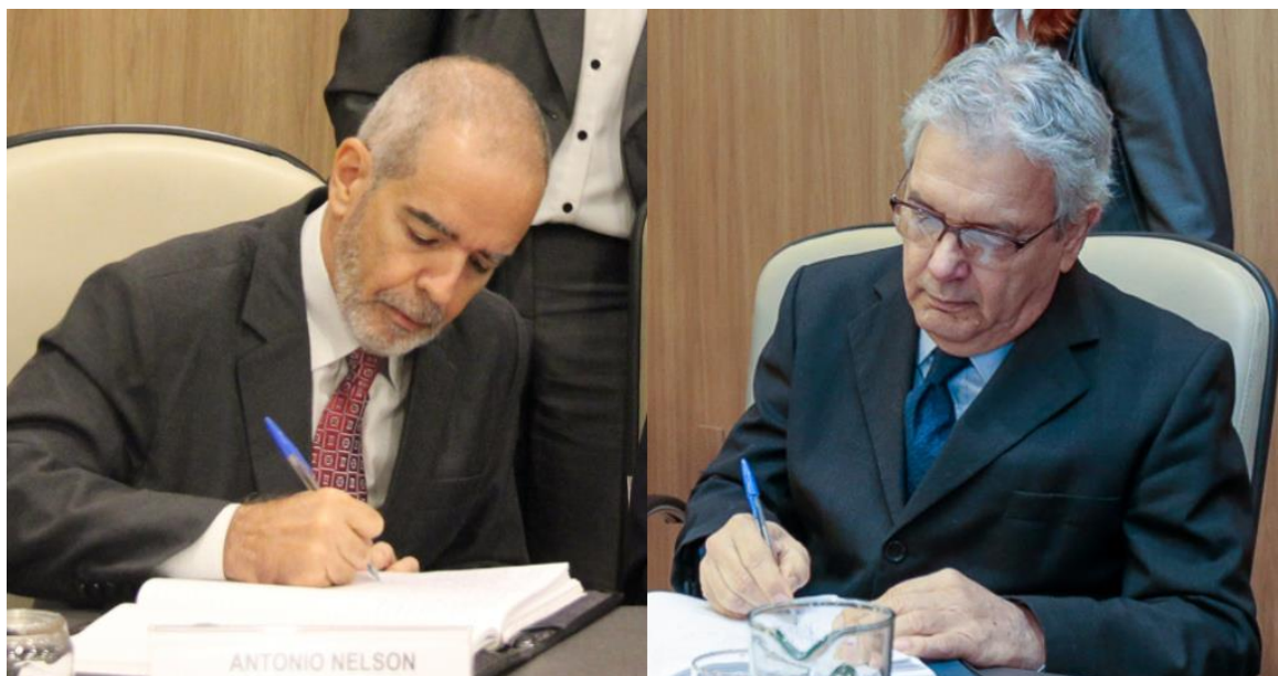
Assinatura do termo de posse.