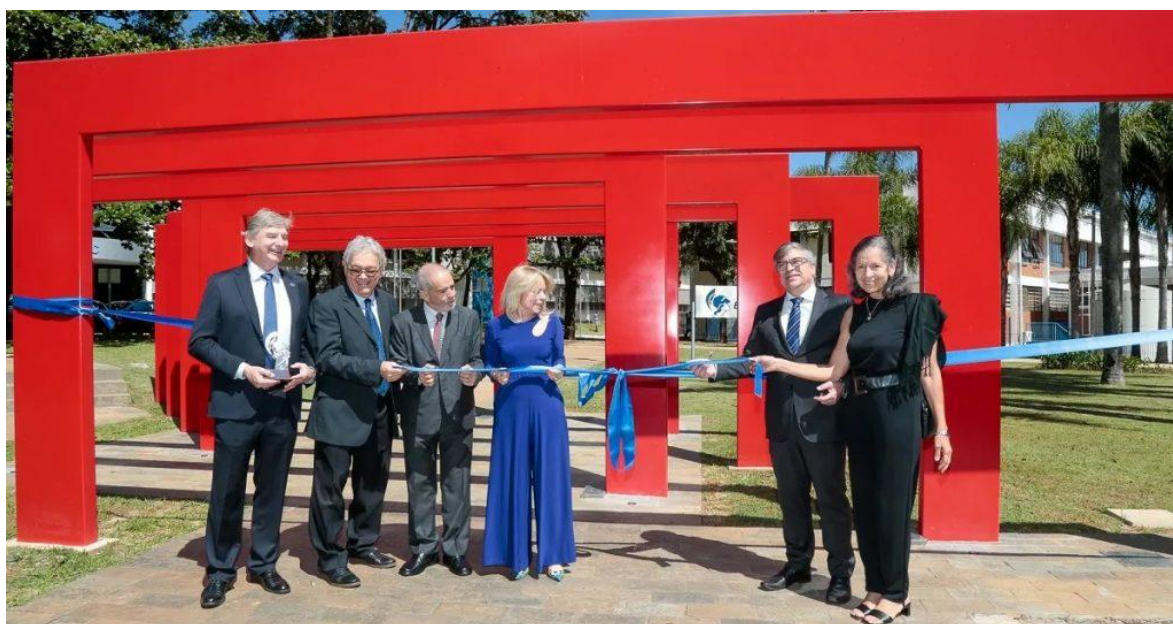
Lançamento do sétimo pórtico do Portal Décadas da EESC.

Na sequência, houve o enterramento da cápsula do tempo, com mensagens deixadas pela comunidade da escola, do campus e da cidade, que deverá ser reaberta no centenário da instituição, em 2053.