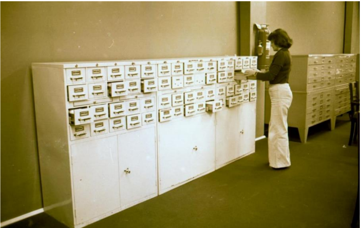
Catálogo em fichas para localização do material bibliográfico no acervo