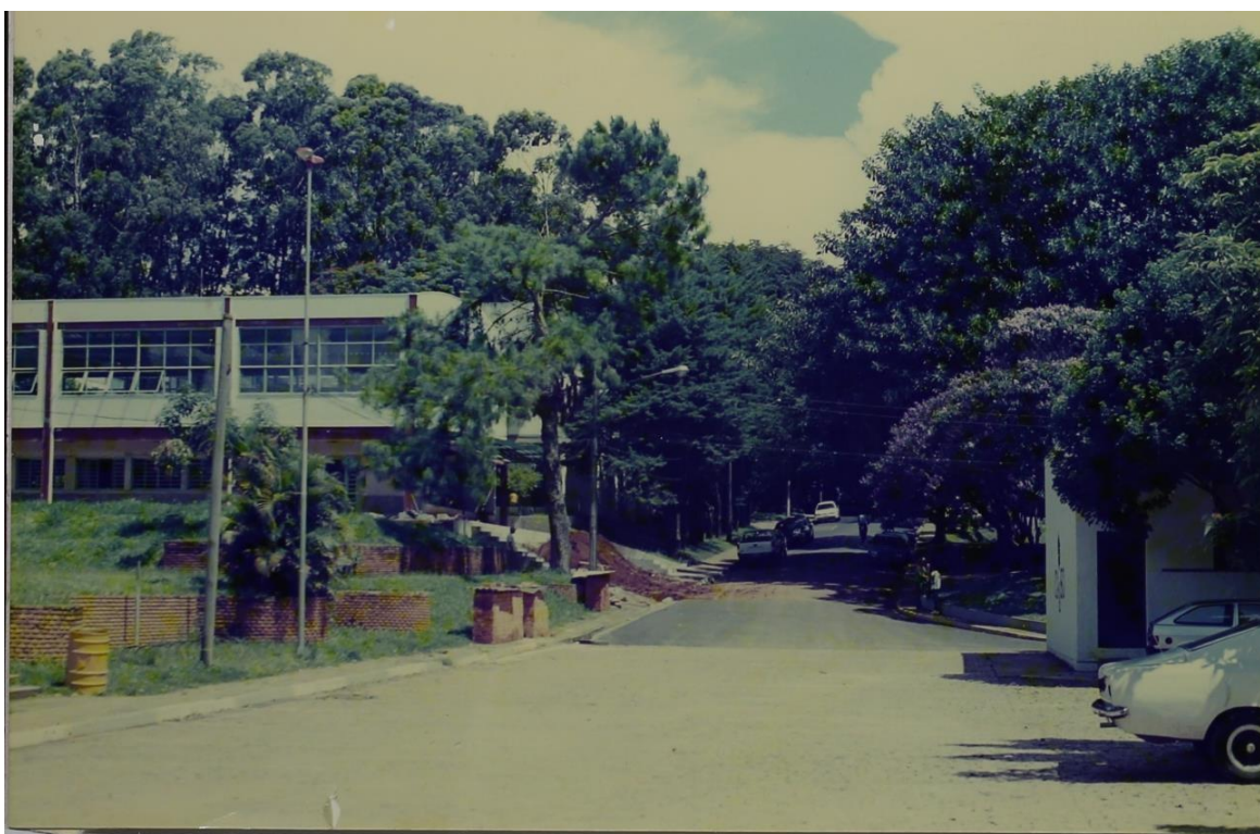
Vista do prédio "Anexo da Biblioteca" ocupado com sala de estudo 24 horas, parte do acervo da Biblioteca EESC e, o restante, pelo CETEPE, Edusp e EESC Jr.