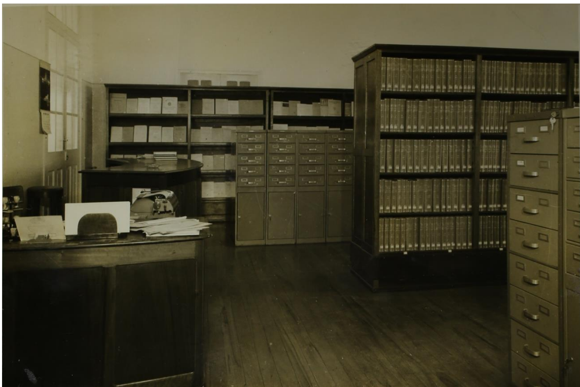
Área administrativa, catálogo em fichas do acervo da Biblioteca da EESC funcionando no edifício da Società Dante Alighieri