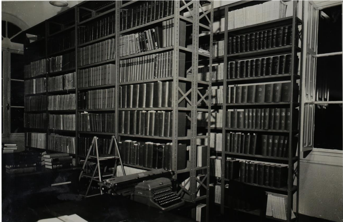
Vista parcial do acervo e área administrativa da Biblioteca no edifício da Società Dante Alighieri