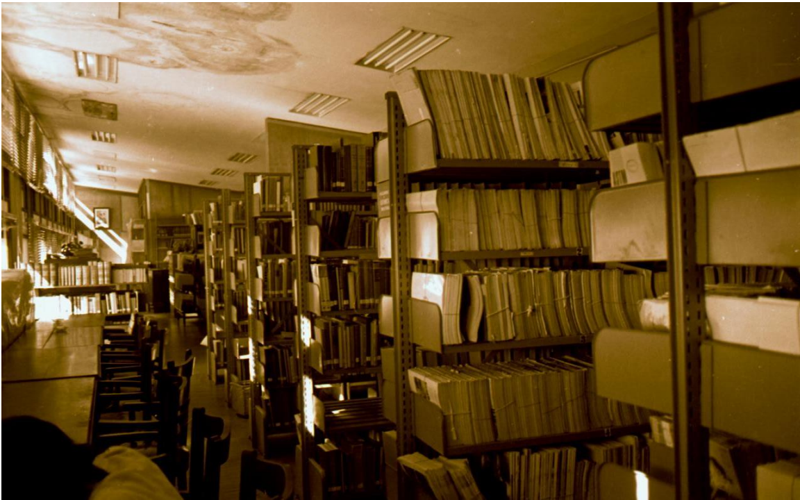
Área de leitura em meio ao acervo da Biblioteca no 3º andar do edifício E1 em 26.02.1972