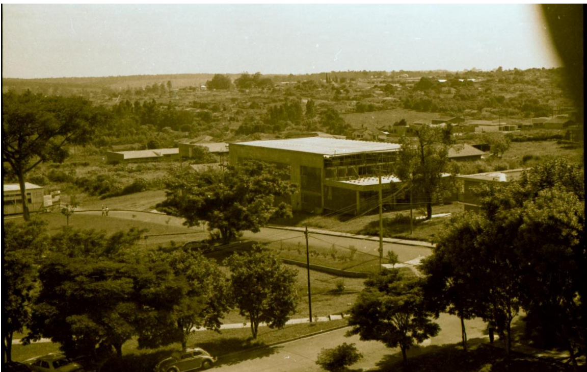
Primeiro bloco da Biblioteca em construção e, ao lado, o prédio do alojamento em 26/02/1972