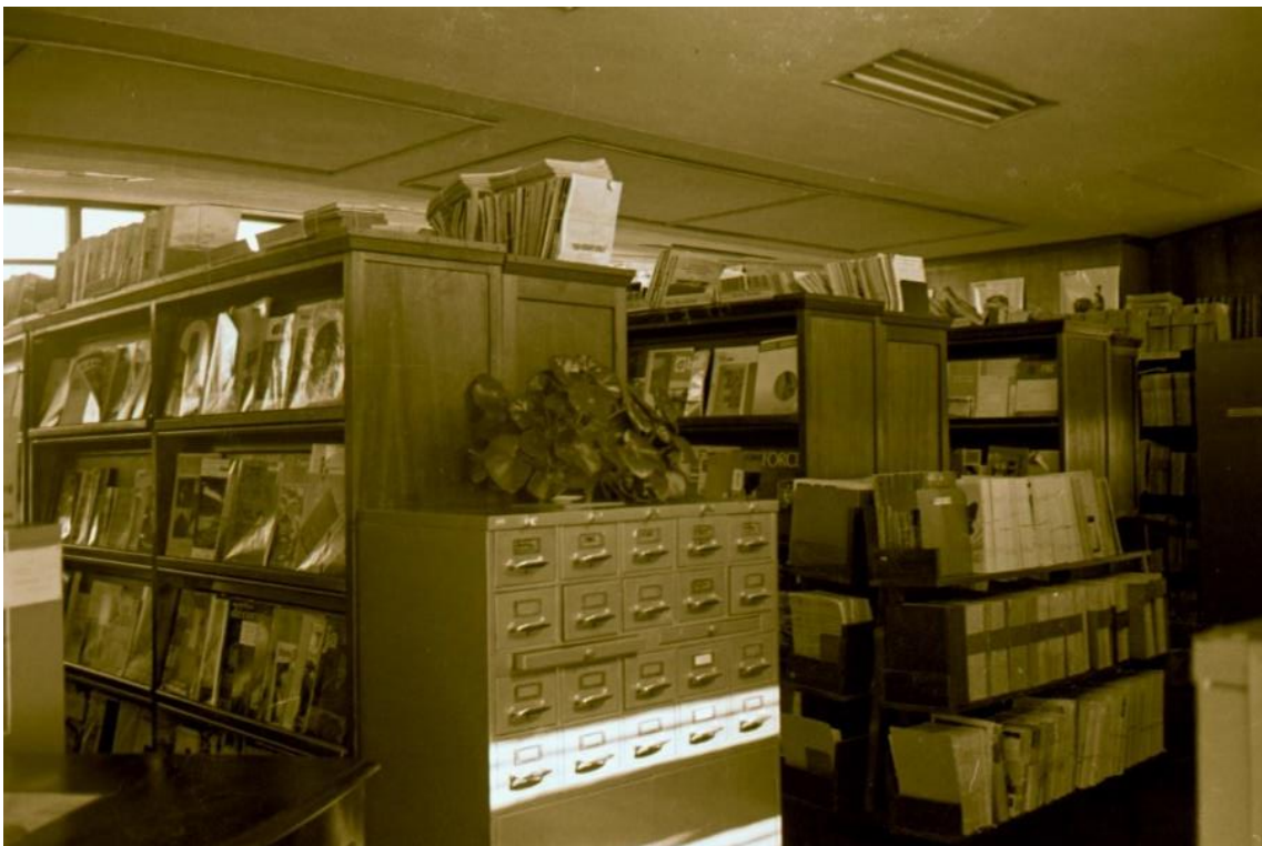
Vista parcial do acervo da Biblioteca no 3º andar do edifício E1