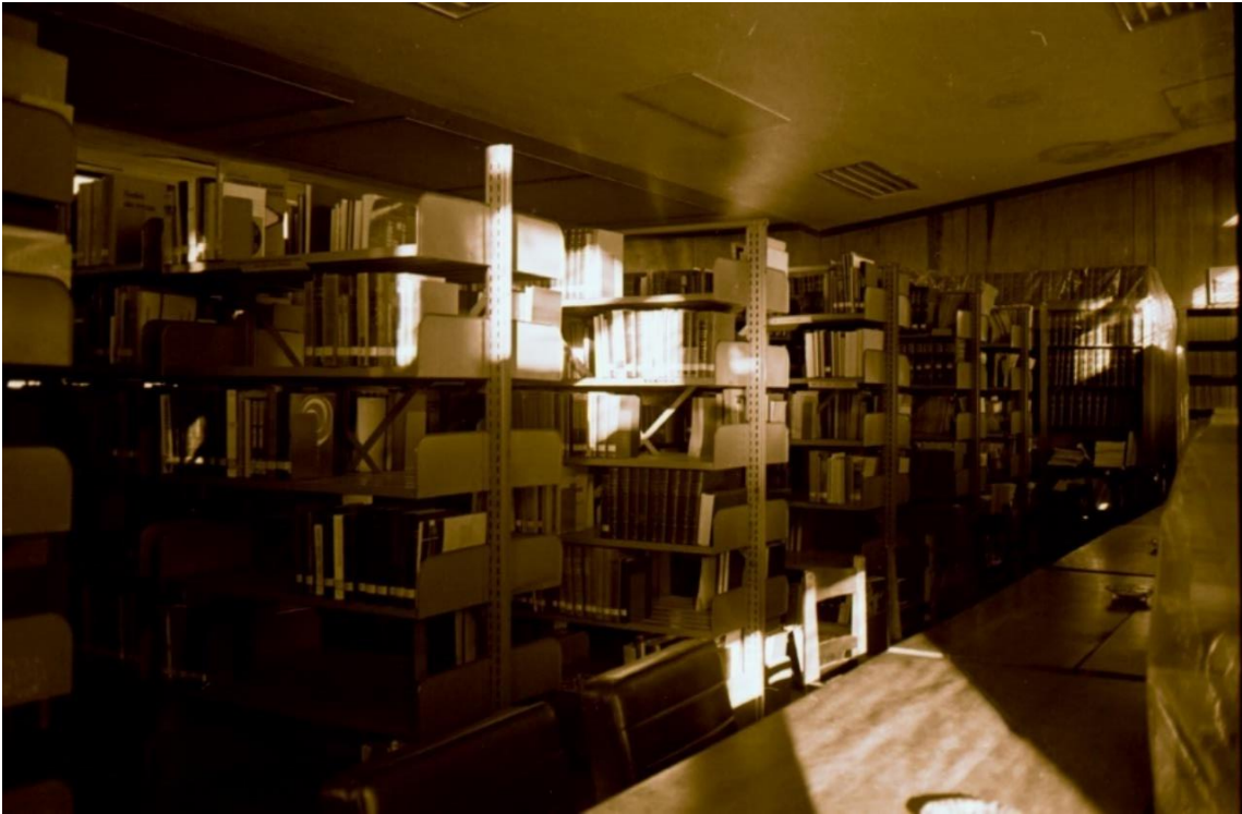
Vista parcial do acervo da Biblioteca no 3º andar do edifício E1