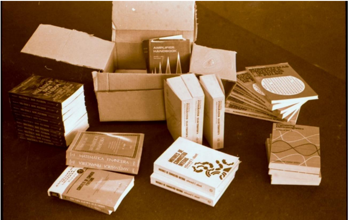
Livros em processamento