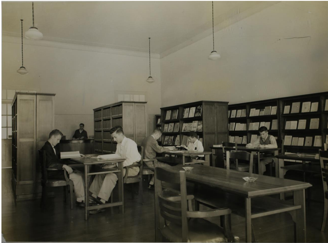
Área de estudo da Biblioteca da EESC em 1955, instalada no prédio histórico a Casa d'Itália, construído pela Società Dante Alighieri onde atualmente funciona o Centro de Divulgação Científica e Cultural (CDCC)