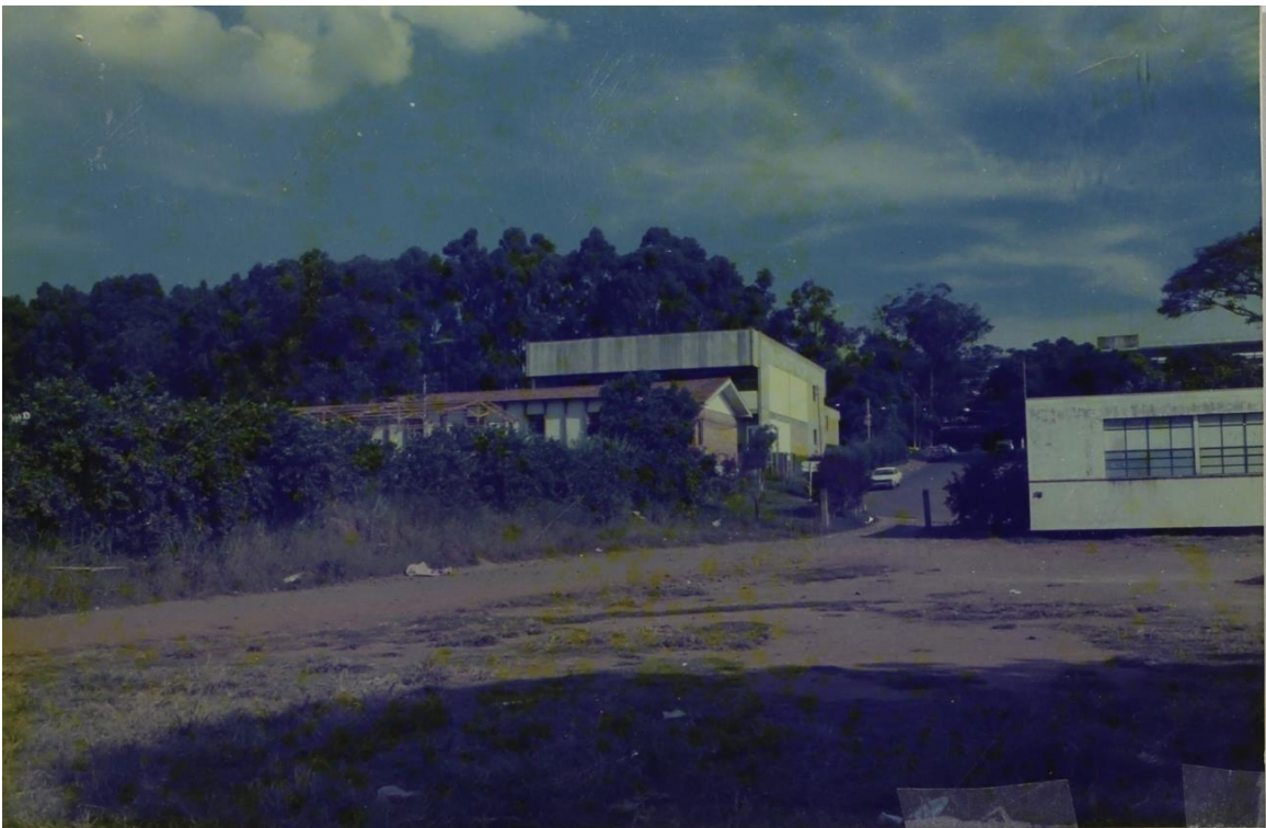
Vista parcial do prédio da Biblioteca (mais alto) e, ao seu lado, o Laboratório de Madeiras e Estruturas de Madeira (LAMEM), Seção de Publicações e Marcenaria e direita parte do prédio do restaurante