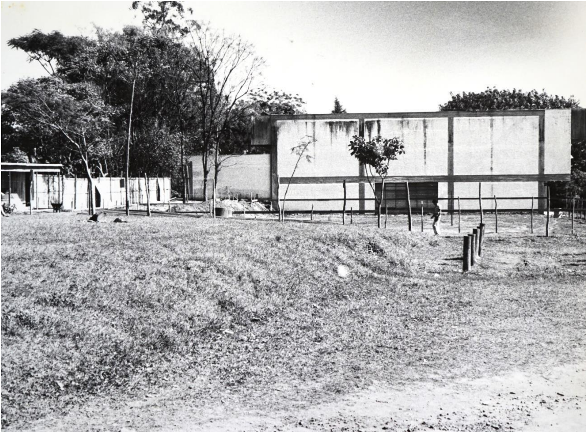
Preparação do terreno para início da obra de ampliação da biblioteca em junho de 1991.