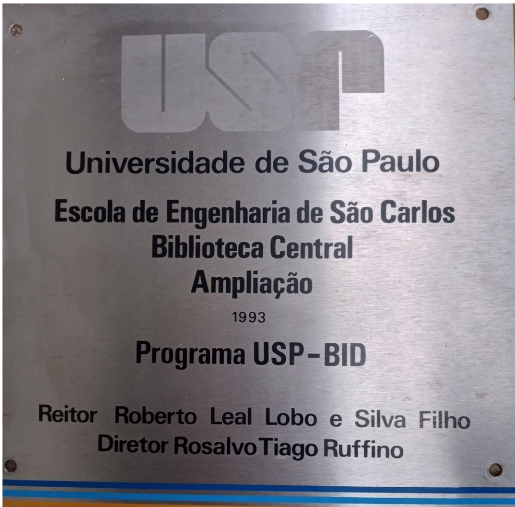
Placa de inauguração do segundo bloco da Biblioteca