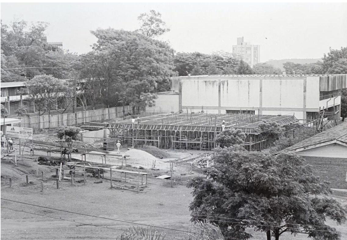
Construção do primeiro piso da ampliação da biblioteca central em setembro de 1991. Autor: Calcinha