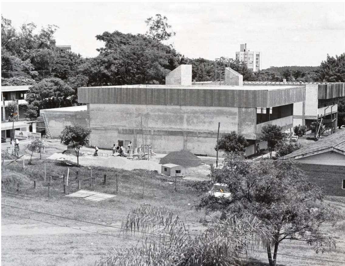
Ampliação da biblioteca central em fase de acabamento, abril de 1992. Autor: Calcinha.