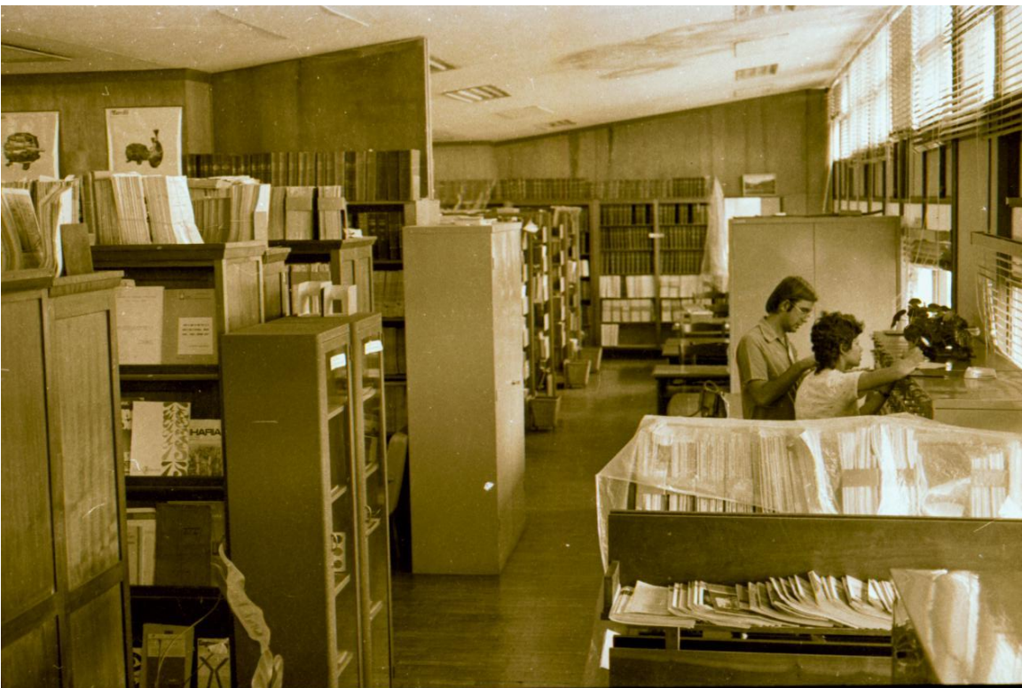
Vista parcial do acervo da Biblioteca no 3º andar do edifício E1. 26.02.1972