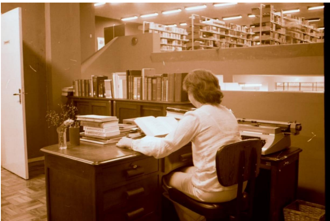
Sala de processamento técnico do material bibliográfico