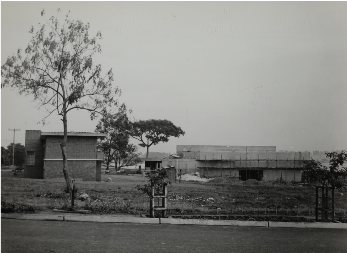
Construção do primeiro bloco da Biblioteca (fundos) e, ao lado, o prédio do 1º alojamento.