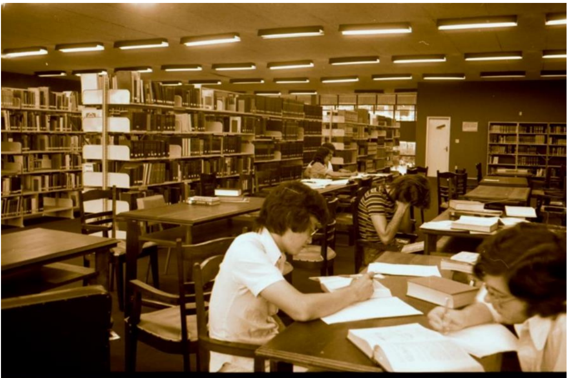
Área de estudo em meio ao acervo