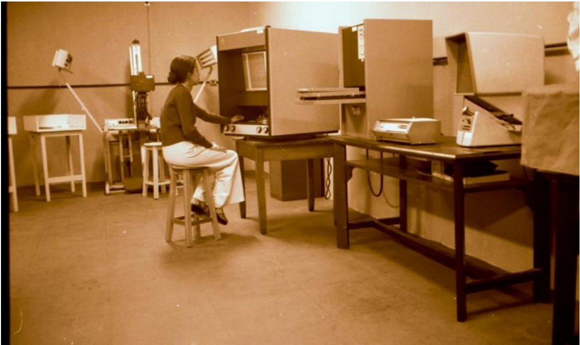
Setor de microfilmagem da Biblioteca