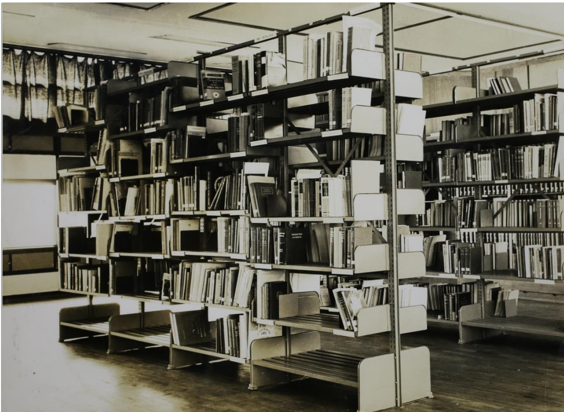
Vista parcial do acervo da Biblioteca no 3º andar do edifício E1 em 1960