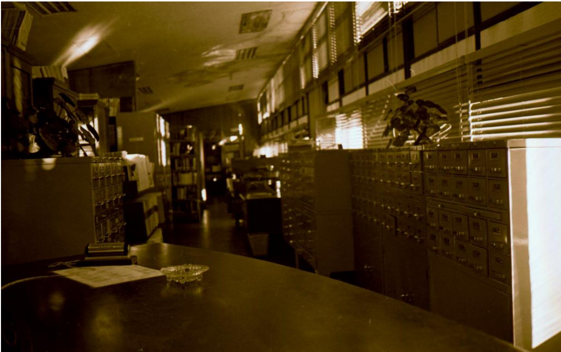
Fichário e parcial do acervo da Biblioteca no 3º andar do edifício E1 em 26.02.1972