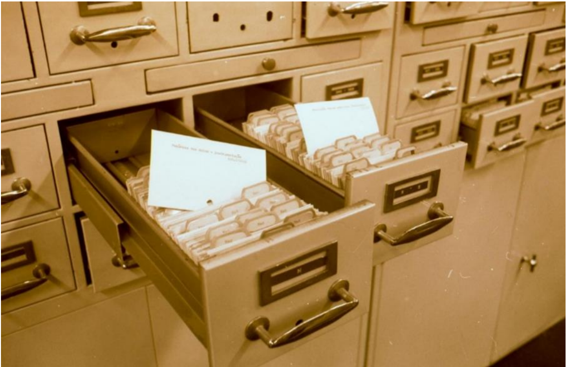
Catálogo em fichas para localização do material bibliográfico no acervo