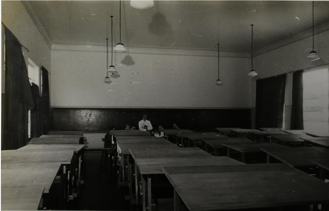
Foto 7 - Sala de aula de desenho técnico nas dependências da antiga Società Dante Alighieri, 1953