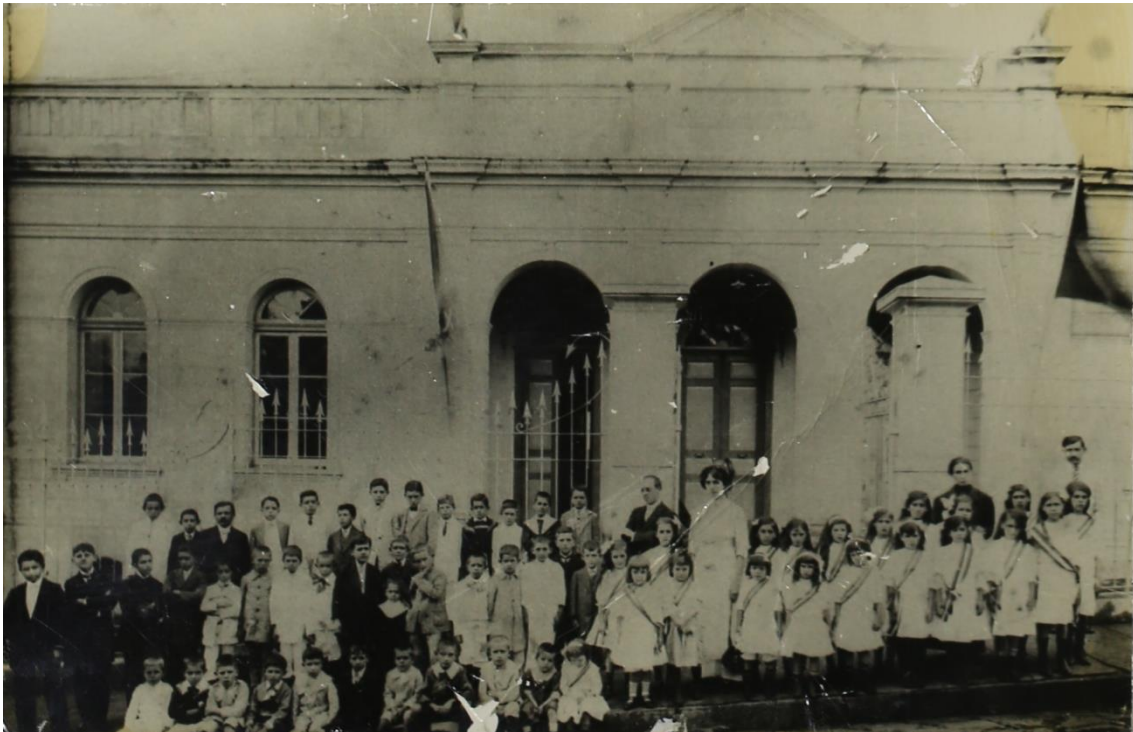
Foto 2 - Edifício Società Dante Alighieri quando o prédio era apenas de um pavimento.