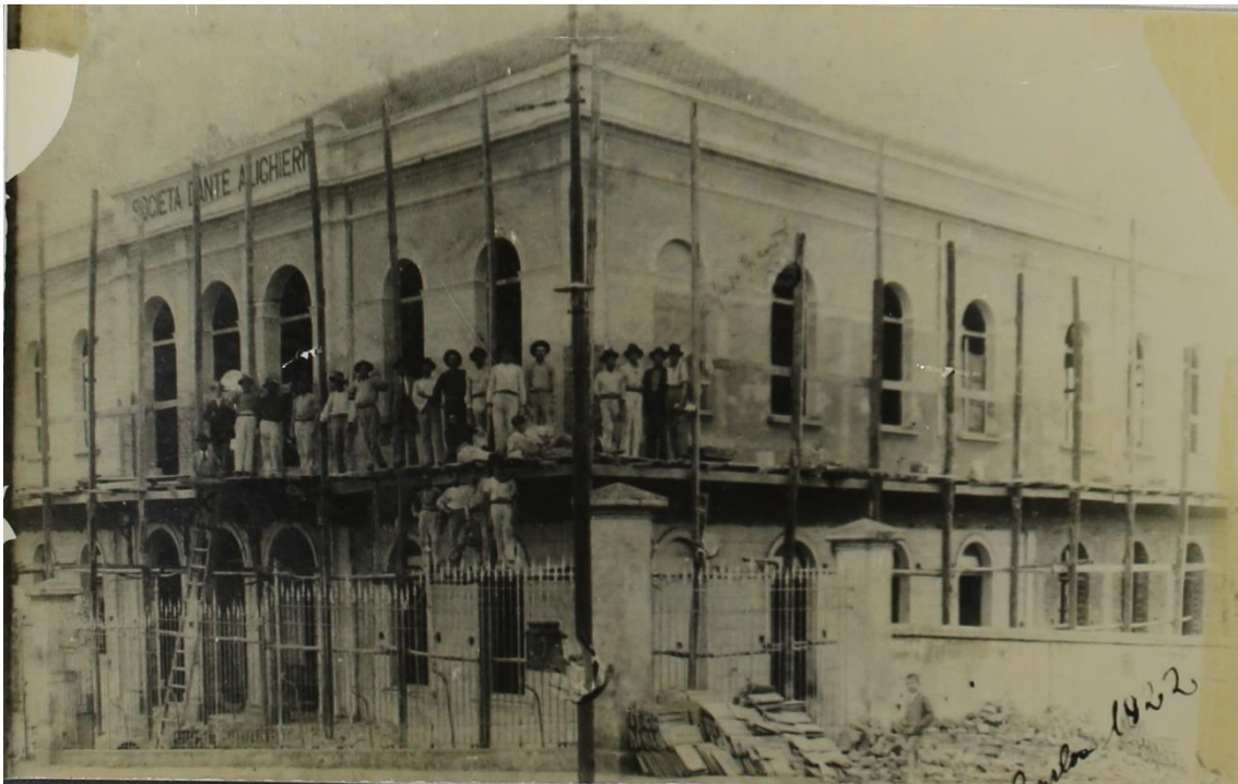
Foto 5 - Finalização da construção do 2º pavimento do prédio da Società Dante Alighieri, destinado às atividades sociais da colônia italiana em 1922