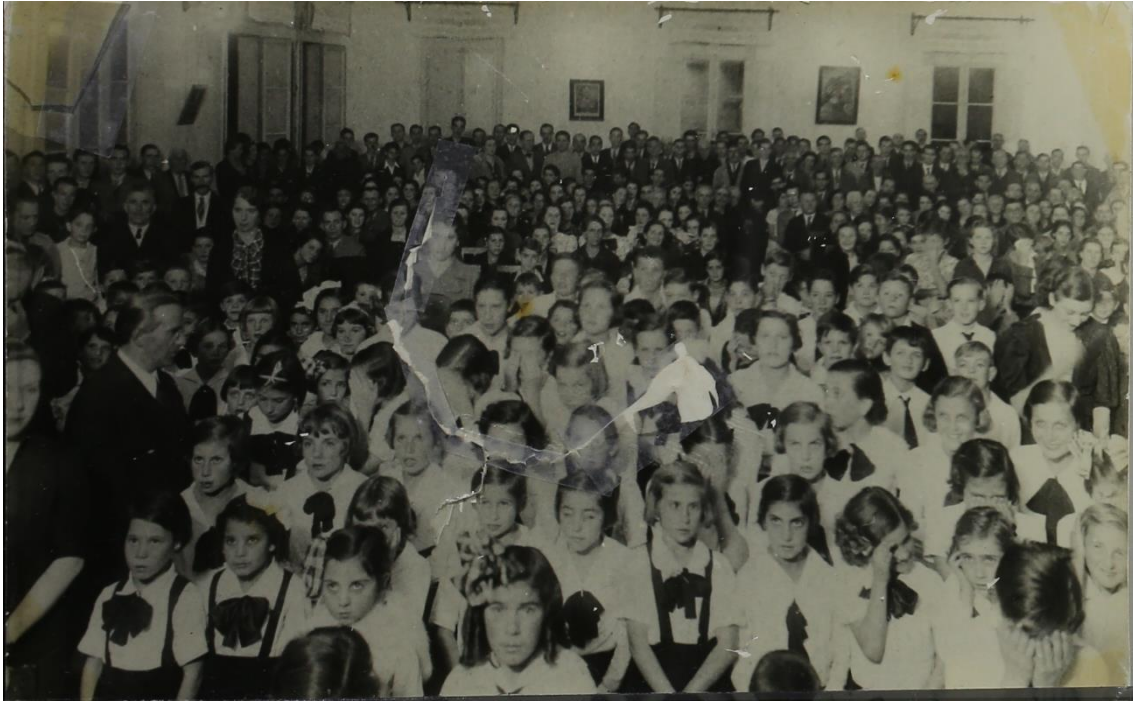
Foto 3 - Crianças reunidas em evento realizado no interior do Edifício Dante Alighieri - EESC