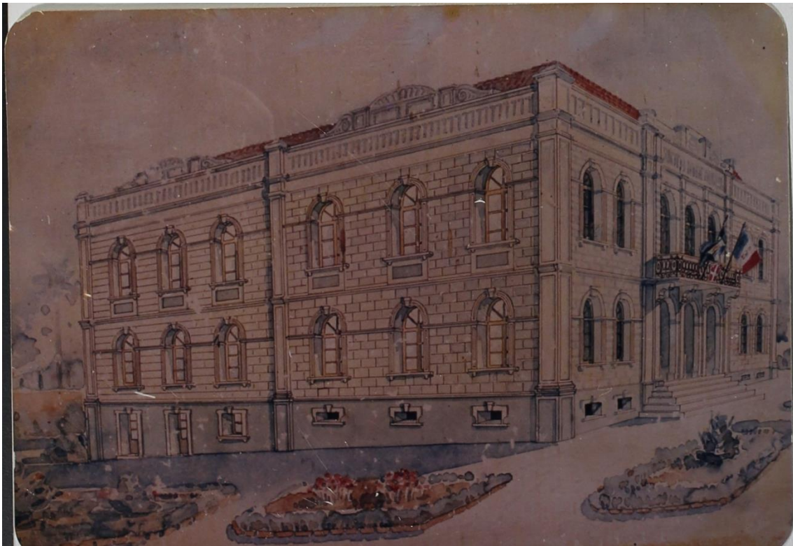
Foto 1 - Esboço do edifício da Societá Italiana Dante Alighieri. Primeiras instalações da Escola de Engenharia de São Carlos.