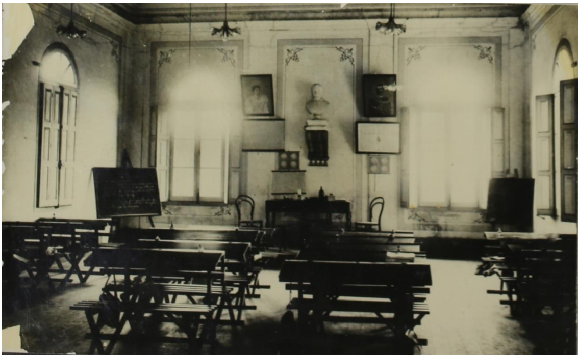
Foto 6 - Panorama da primeira sala de aula da EESC nas dependências da antiga Società Dante Alighieri. Destaque pintura e detalhes da época, 1953