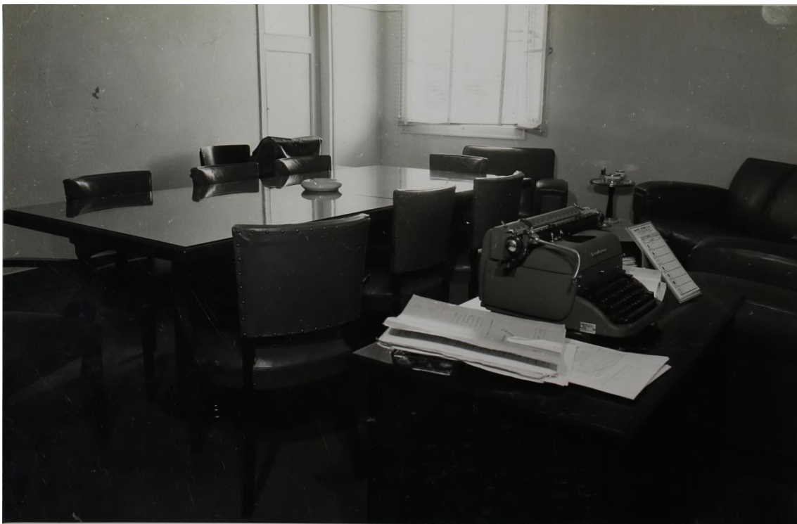
Foto 8 - Sala de reunião da Diretoria da EESC nas dependências da antiga Società Dante Alighieri em 1953